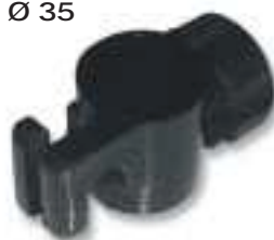
Einstellbare Schelle Ø 35