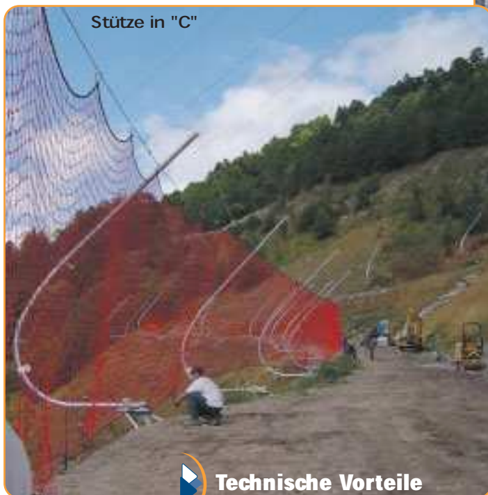
Stütze in "C"