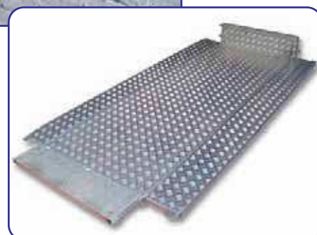
Sponde laterali e posteriori ribaltabili